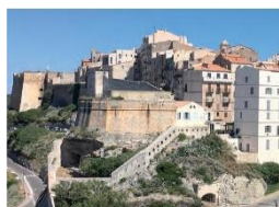
BONIFACIO HABITER UNE VILLE HISTORIQUE CONFRONTÉE AU TOURISME

La résidence d'architectes est un projet culturel créant les conditions d'une rencontre entre un architecte accompagné d'un ou plusieurs autres professionnels, et des populations, des élus, habitants, acteurs locaux, sur un territoire, ou dans un contexte, donnés. L'architecte et son binôme sont accueillis pendant plusieurs semaines dans un territoire où ils sont en immersion. Ils habitent et travaillent sur place.